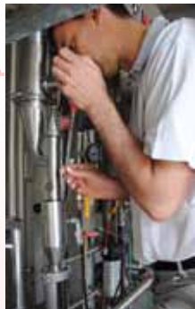
Abschöpfen von Steirischem Rosenöl