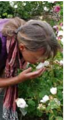
Die Rose „Madame Hardy“ verströmt einen betörenden Duft.

Weiterhin besitzen Rosenpräparate entspannende und schmerzstillende Wirkungen sowohl auf die Psyche als auch auf die Muskulatur. So liegen gute Erfahrungen bei der äußerlichen Anwendung bei Ohrenschmerzen, Spannungskopfschmerz und Neuralgien vor. Rosenöl hat einen sanft durchwärmenden Charakter, ist reizmildernd, beruhigend und entzündungshemmend. Spagyrisch zubereitete Rosenblütenblätter stärken die Hautfunktionen und machen sie widerstandsfähiger. Ein positiver Einfluss bei Akne, Schuppen und auf die Wundheilung rissiger Haut ist zu beobachten.