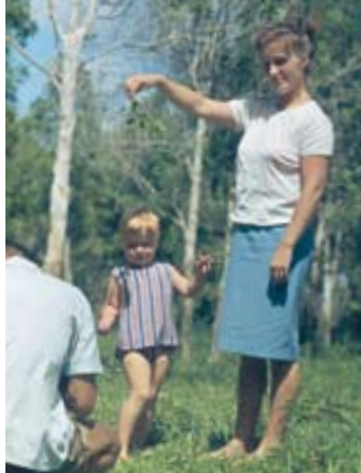
Die Familie der Autorin 1966 in einem Nelkenhain auf Sansibar