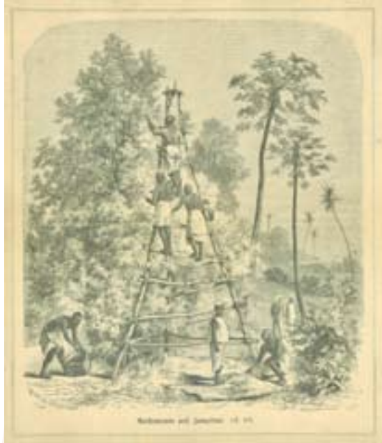
Nelkenernte Anfang des 20. Jahrhunderts auf Sansibar, Radierung