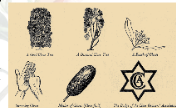
Die Nelke im Sachkunde-Unterricht von Sansibar, 1961

Der botanische Gattungsname „ Syzygium “ stammt vom griechischen „ syzygos “. Dies bedeutet „gepaart, vereinigt“ und charakterisiert die Blütenblätter, welche zu einer Haube verwachsen sind. Die alte lateinische Bezeichnung „ Eugenia caryophyllata “ für die Gewürznelke ist inzwischen überholt. Der Gattungsname „ Eugenia “ stammt von Prinz Eugen von Savoyen (1663–1736) ab, der ein Förderer und Eigentümer eines botanischen Gartens war. „ Caryophyllata “ ist dem altgriechischen „ karyophyllon “ abgeleitet, wobei wahrscheinlich die griechischen Händler das Wort ihren südasiatischen Lieferanten abgelautet haben. So ähnelt es dem Sanskritwort für „scharfe Frucht“.